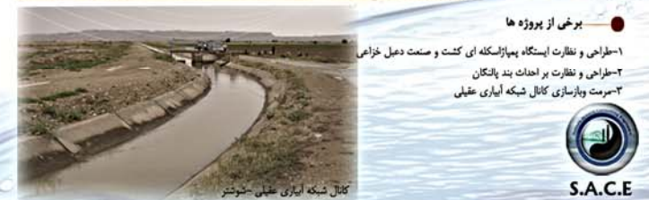
کانال شبکه آبیاری عطیلی - خروست