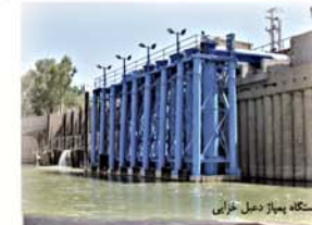
ایستگاه بهیاز دخیل خرابی